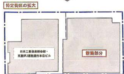
図表2 特定街区の拡大